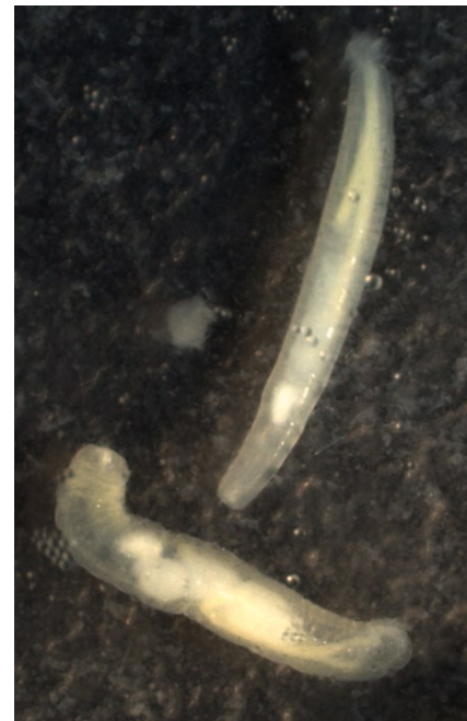
Şekil 3. Neoechinorhynchus rutili 'nin genel görünüşü (x50).